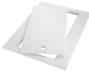
Planche de découpe Twin in HDPE 8644 101