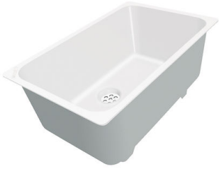
Cuvette blanche 8153 100