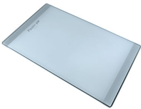
Planche de découpe en verre 8631 300