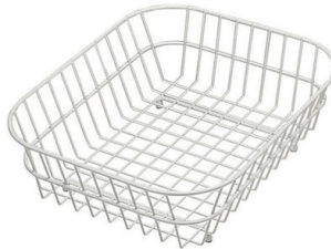
Panier en acier inoxydable 8612 000